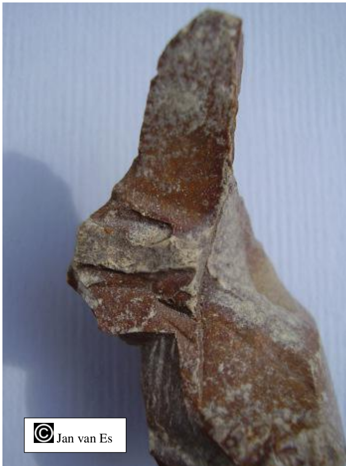
Figur eines Hasen aus dem Besitz des Jan van Es aus Roermond, Niederlande Figure of a hare owned by Jan van Es in Roermond, Netherlands