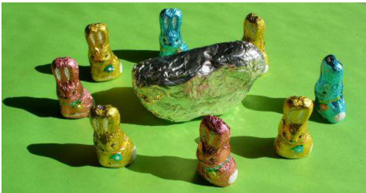
Fund unter einer Aluminiumfolie mit Osterdekor Finding under a sheet of aluminum with Easter décor