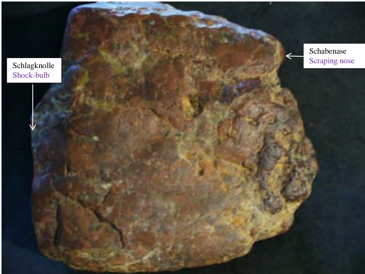
Stein fotografisch unbearbeitet