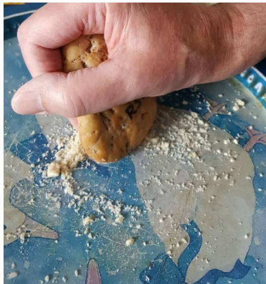
Während der Arbeit During work