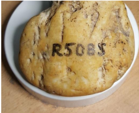
kreisförmige Unterseite circular bottom

A highlight of this tool is the hump in the upper area, which allows the fingers to hang comfortably. Another highlight is the almost circular bottom, which was used both for splitting and for rubbing the grain materials and can still be used today in this way.