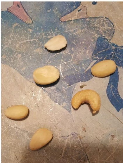
Material: gebleichte Mandeln Material: bleached almonds