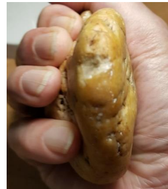
Zugriff auf Griffbuckel in 2 Phasen Access to handle hump in 2 phases.