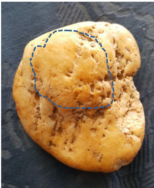
Oberseite mit Griffbuckel

This quartz stone weighs 353 gr. and has the dimensions of 9 x 8 x 4 cm.