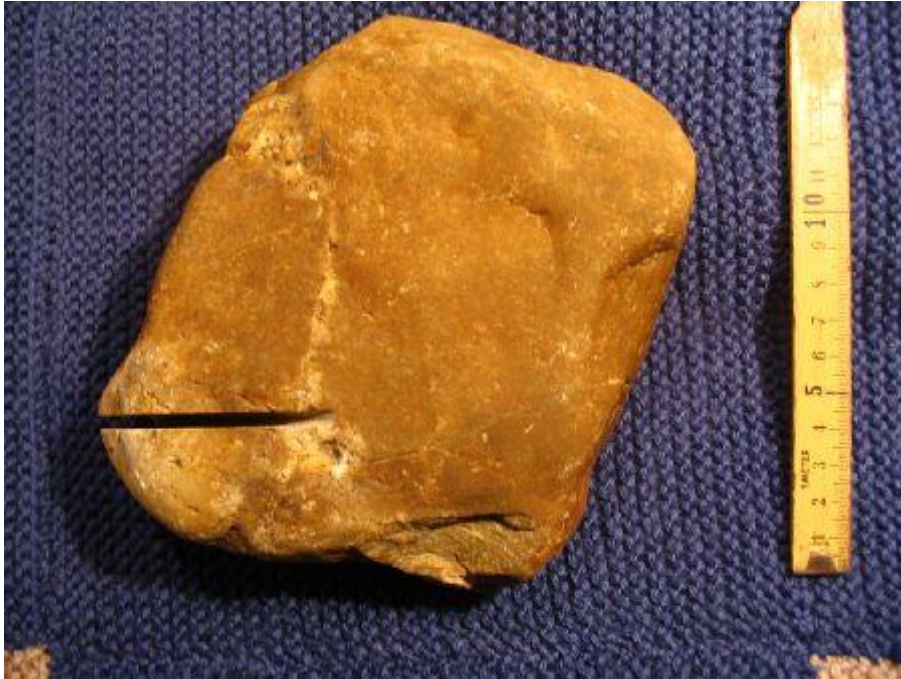
Fund V911 Liza - Kopf eines homo habilis Fund V911 Liza - Head of a homo habilis