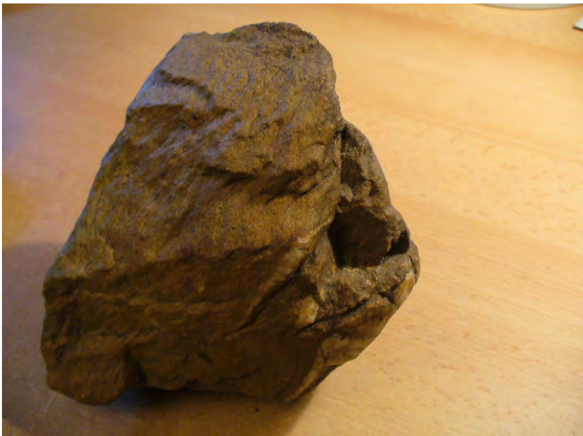
Jäger im Profil an der rechten Steinseite