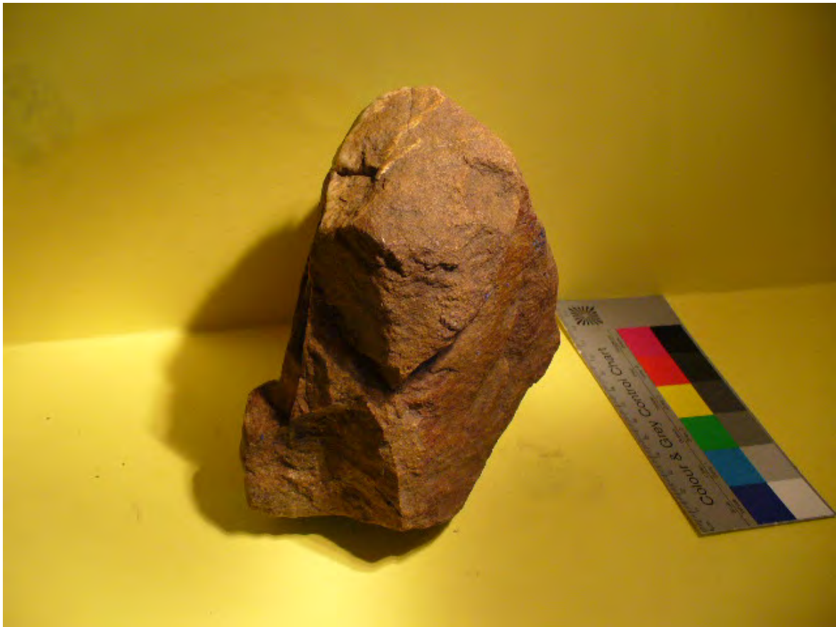
Mammut von Vorne

Es handelt sich um einen Haustein, in welchen der steinzeitliche Jäger und Künstler sein Jagdgut - ein Mammut - und sich selbst in einer Skulptur hineingemeißelt hat.