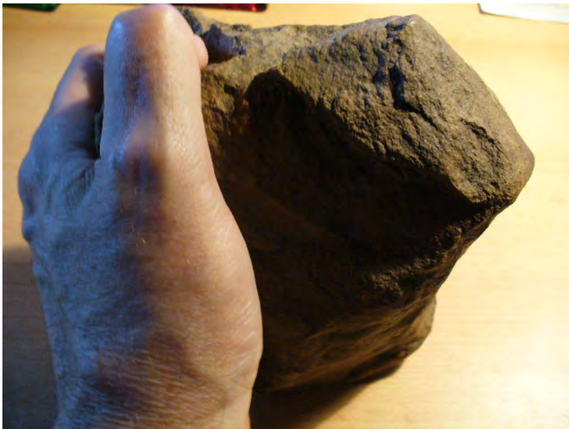
Linker Daumen in Griffstelle