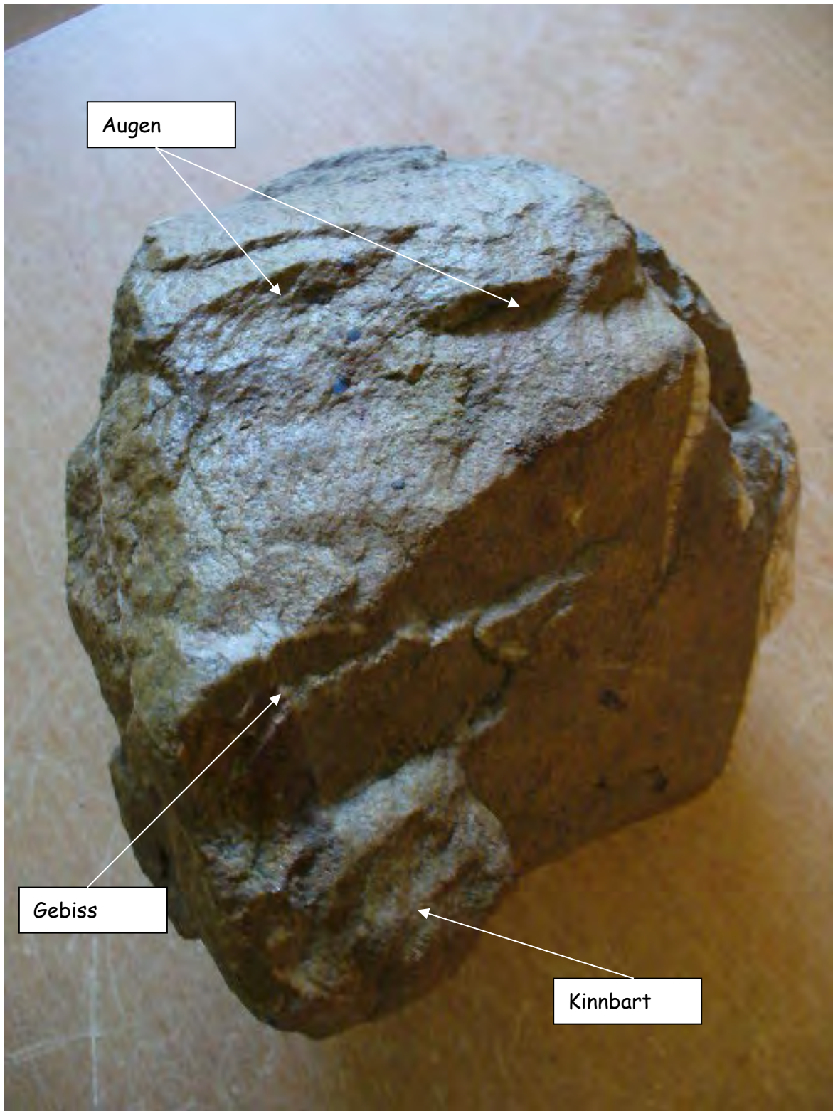
Zweites Gesicht im Gegenlicht

Der Daumengriff des Folgebildes ist der Bart.