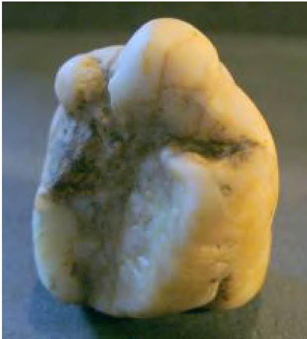
Seitenansicht von rechts