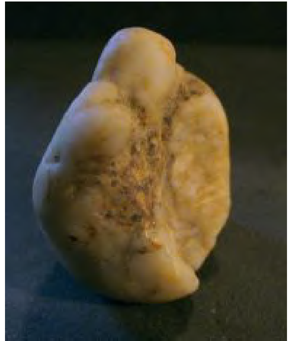
Seitenansicht von links