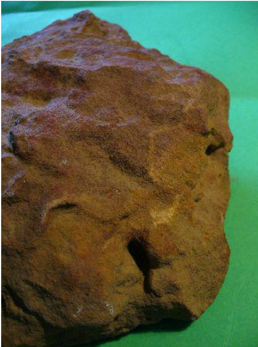
Bärengesicht Face of a bear

Die Paläolithiker wandten oft den Kunstgriff der Kombination von Menschen- und Tierportrait an. So nutzten sie nebenbei auch das Werkmaterial vollständig aus. The Paläolithiker is often applied the artifice of the combination of human and animal portrait. Thus fully exploiting also the material working with.