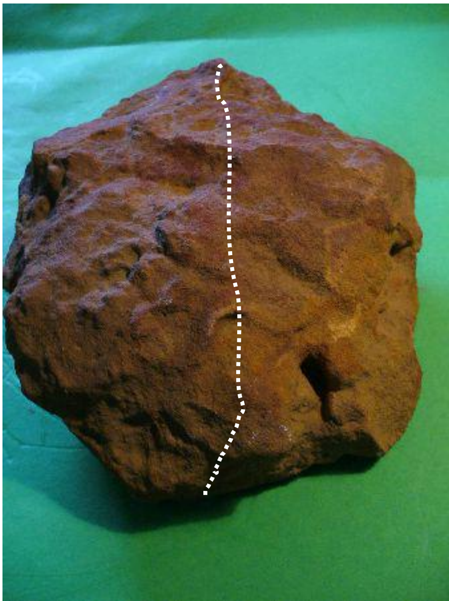
Links Mensch - rechts Bär mit ungefährer Scheidelinie Left human - right bear with approximate separating-line