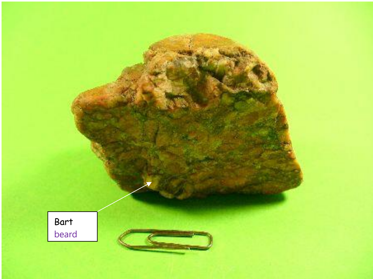
Abgeschnittene Gegenseite mit Bart Cut opposite side with a beard