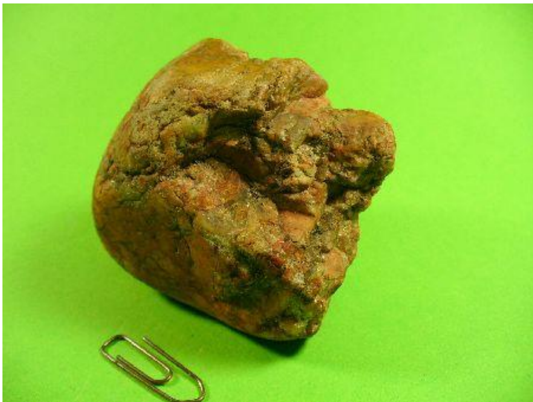
Seitlich On the side