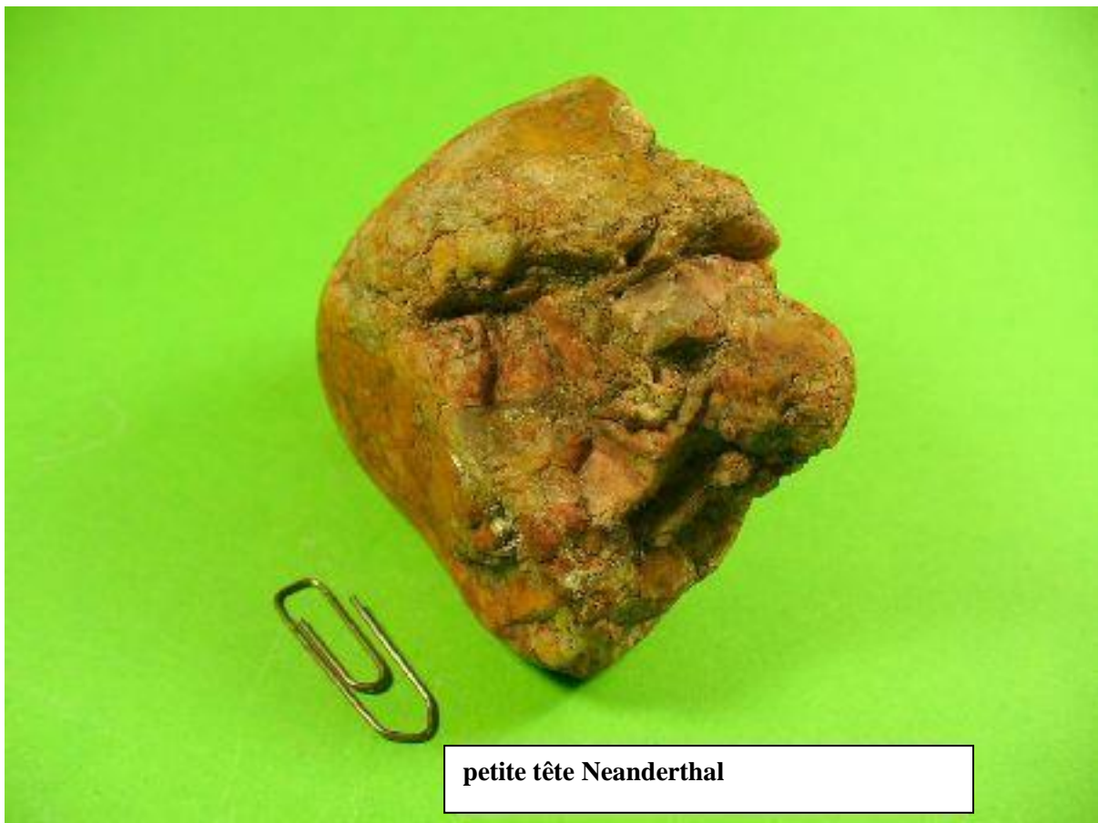
Von vorne seitlich

This reddish granules stone (granite?) weighs 186 gr. and has the dimensions 6 x 5 x 3 cm.