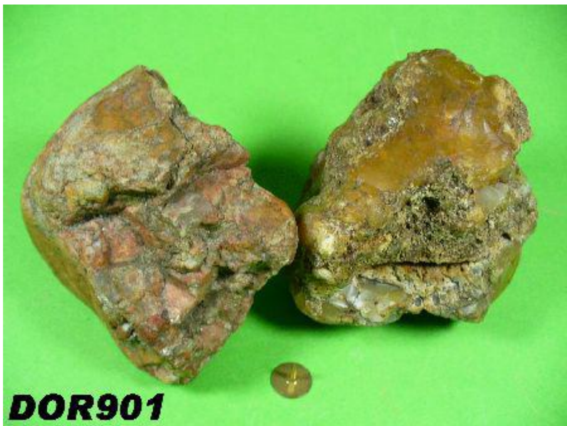
Neandertaler- und Löwenkopf sich berührend Neanderthal and lion's head are touching each other