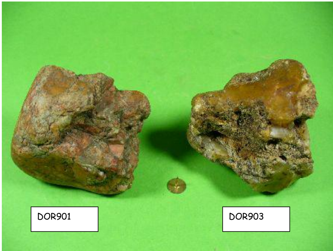
Ähnlichkeit zwischen Funden DOR901 und DOR903 - je eine Seite voll ausgearbeitet . Similarity between finds DOR901 and DOR903 - each a page fully worked out .