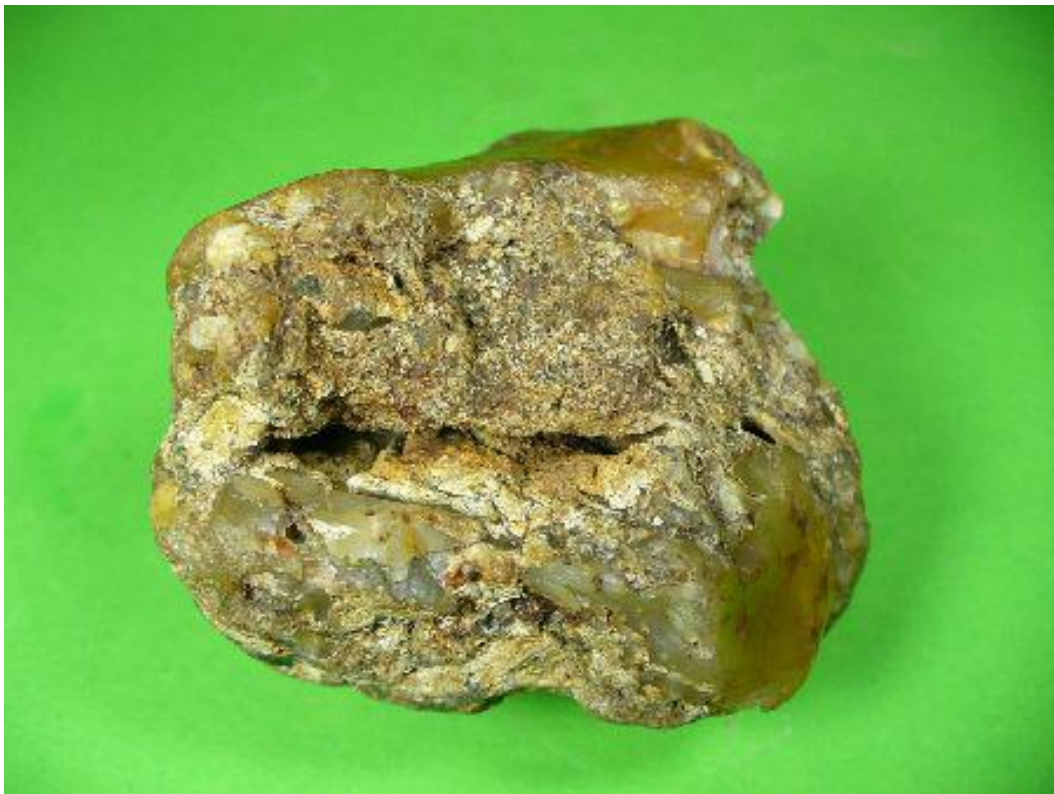
Die Eckzähne sind dargestellt. Die für den Löwen typische Zahnücke ist herausgearbeitet. Dahinter folgen die 3 Backenzähne. The canines are shown. The gap typical for the lion is worked out. Behind of it follow the 3 molars.