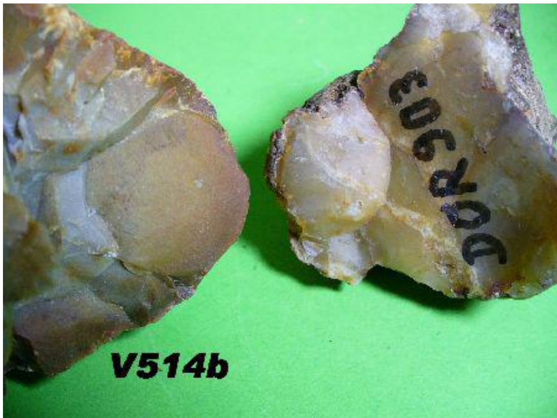
Spalterscheibe wie bei V514b Disk for splitting like in V514b