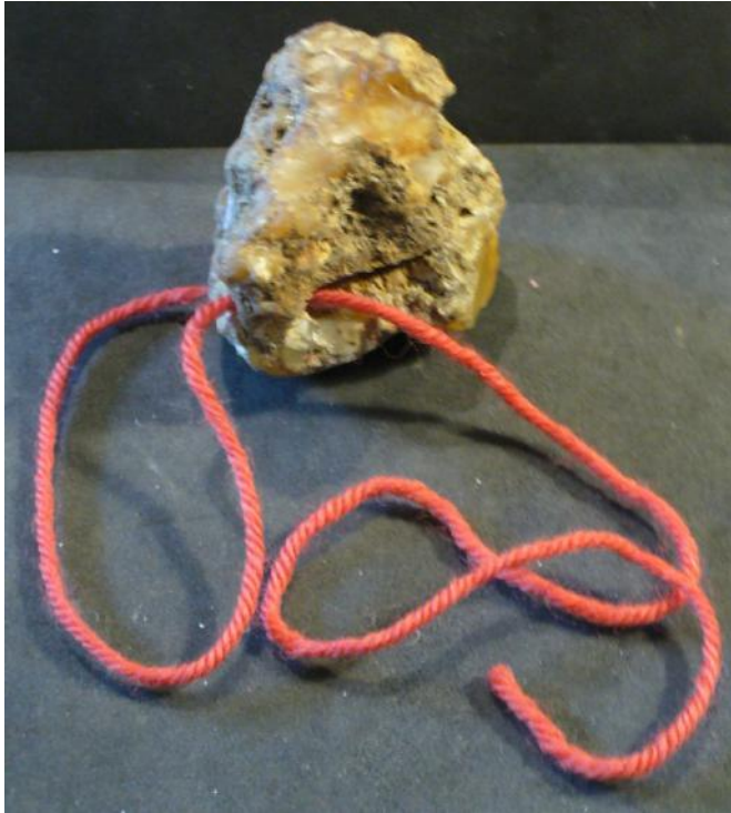
Löwenkopf mit durchgezogener Schnur Lion's head with pulled cord