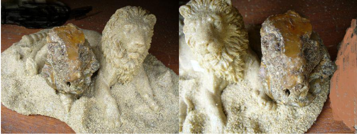
Figur im Vergleich mit einer modernen, kommerziellen Nachbildung eines Löwenkopfes 2 Figure compared with a modern, commercial reproduction of a lion's head