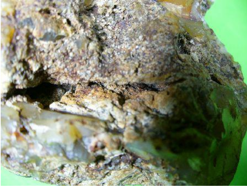
Gebiss mit perforierter Zahnücke aus der Nähe Teeth with perforated gap close up