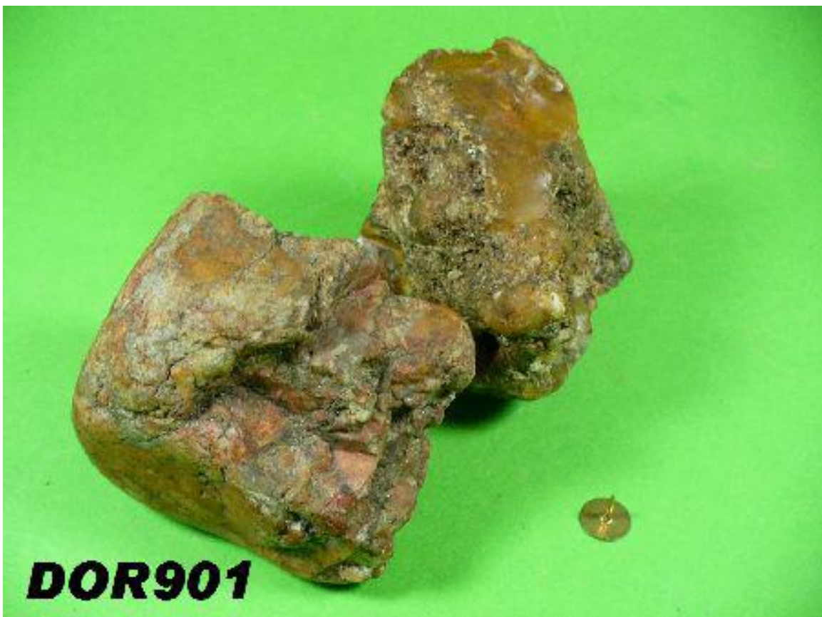
Ähnlichkeit zwischen Fund DOR901 , petite tête Neanderthal, und Fund DOR903 Similarity between finding DOR901 , petite tête Neanderthal, and finding DOR903