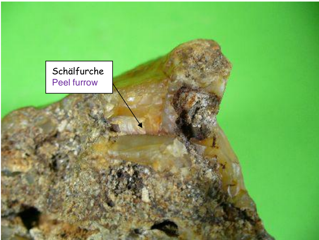
Sehnenschälfurche The tendon-peel-furrow