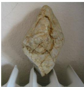
Madonnenfigur auf Heizkörper

Concerning the child: the head, the body, and the buttocks.