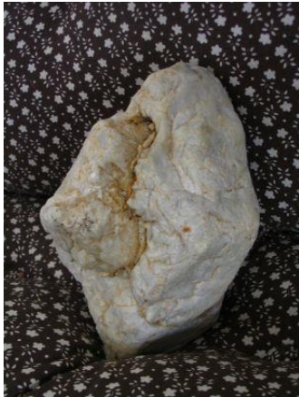
Seitliche Ansicht side view

The figure stands independently on a surface of 15 cm 2 , although 4.5 cm 2 is missing the original pedestal of fresh fracture.